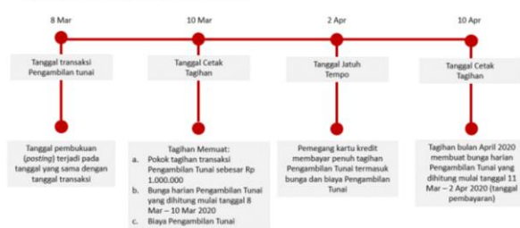
Ilustrasi Perhitungan Bunga Transaksi Tarik Tunai (Cash Advance)

Bunga untuk Pengambilan Tunai (Cash Advance) dibebankan dan dihitung sejak Tanggal Penarikan (Cash Advance) sampai dengan tanggal dilakukannya pembayaran penuh dari transaksi Pengambilan Tunai tersebut. Suku bunga yang berlaku untuk transaksi Pengambilan Tunai tercantum pada Lembar Penagihan. Biaya, denda, ataupun bunga yang belum dibayarkan tidak termasuk dalam komponen perhitungan bunga. Untuk perhitungan bunga secara lengkap dapat dilihat pada ilustrasi Perhitungan Bunga Kartu Kredit.